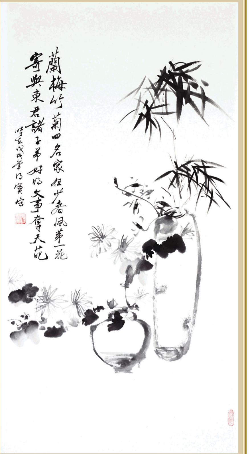
▲一等奖：《花中四君子》 作者：叶得宝（山东省高级人民法院）